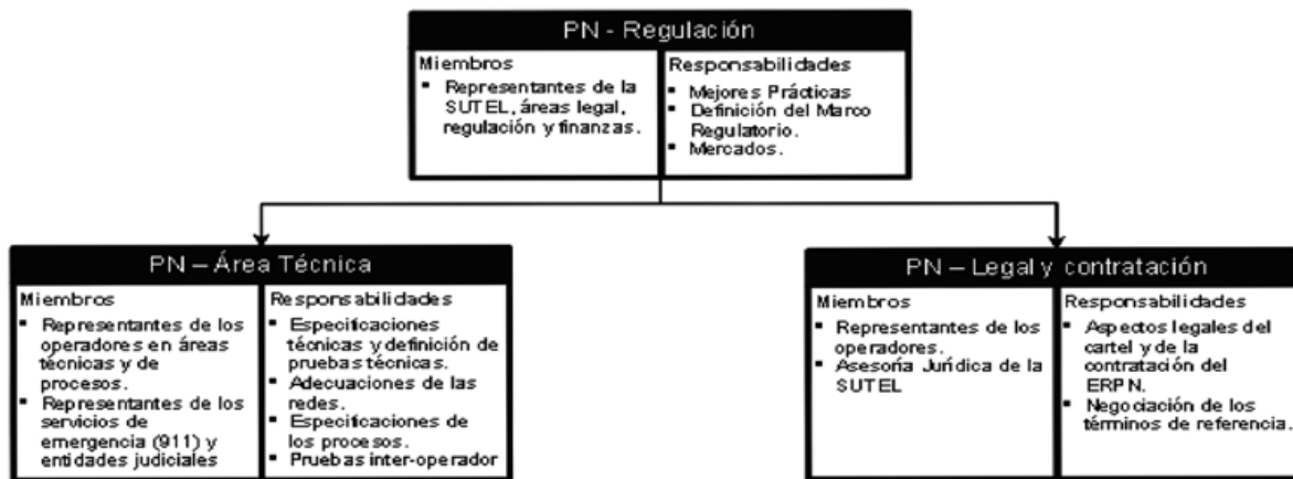
Figura 1. Estructura del Comité Técnico de Portabilidad Numérica.