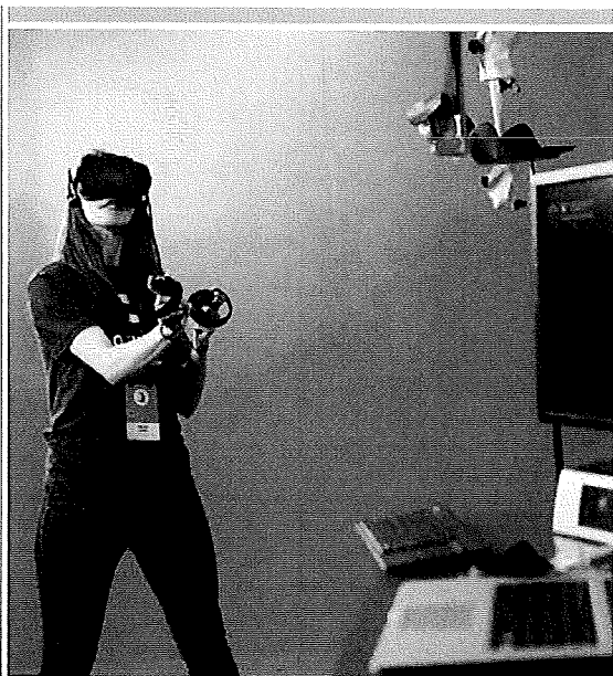
Una usuaria utilizaba, este martes, las gafas Oculus Rift, de la compañía Facebook, con las cuales trabajará la nueva herramienta.