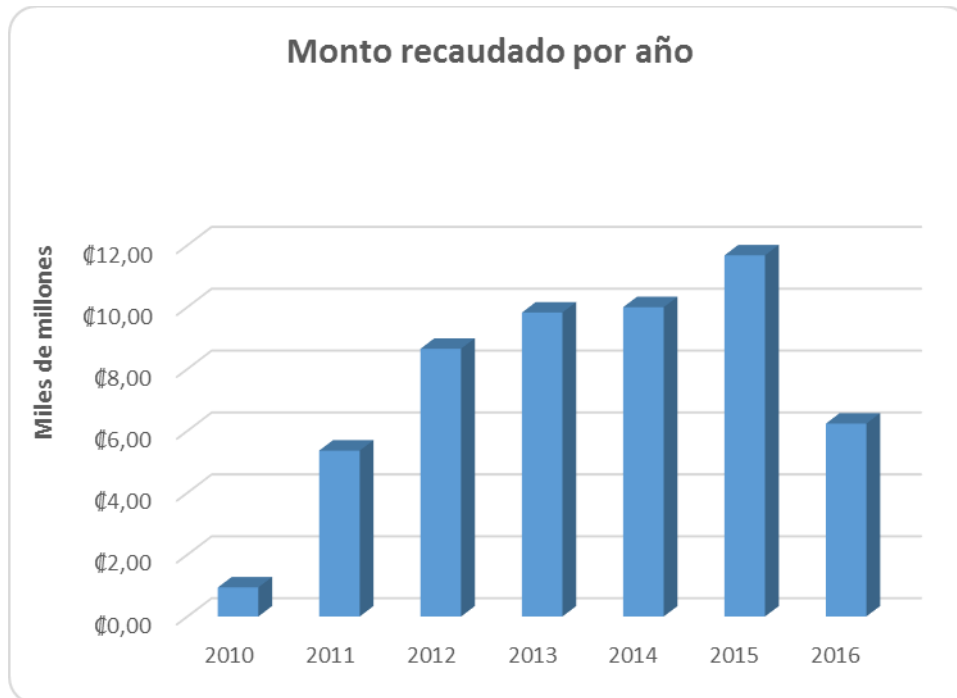
Gráfico 2: Comparativo de recaudación anual