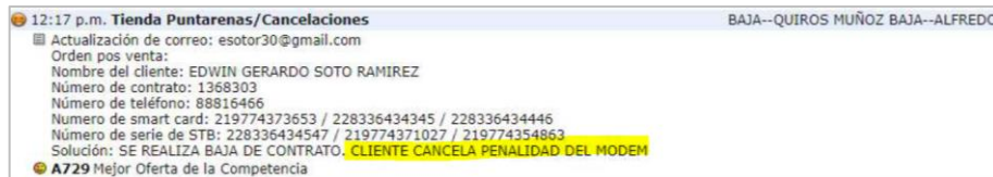
Imagen 1: Desconexión del servicio y pago de penalidad.

al cobro de la penalidad por retiro anticipado realizado en fecha 28 de diciembre de 2020; es decir, ésta se originó en un único hecho . En este sentido, nótese que la multa por retiro anticipado fue cancelada por el recurrente desde el mismo día de la desconexión, por lo cual no estamos frente a una deuda pendiente de pago o la reiteración de alguna anomalía, es decir, no hay hechos continuos. Lo anterior fue confirmado por el operador, mediante correo electrónico de fecha 9 de julio de 2020, según se evidencia en la siguiente captura: