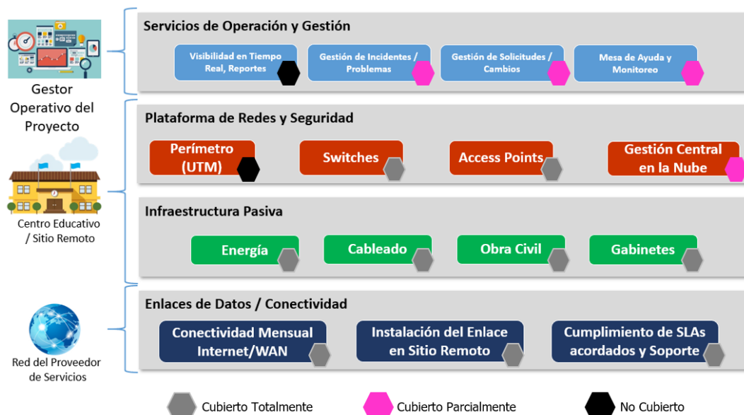
Figura 1 Alcance total red educativa bajo Programa 1 y Programa 4.

VII. En relación con los componentes indicados anteriormente, la SUTEL en su informe 06025-SUTEL-DGF-2020 delimitó de forma clara, cuáles de estos serían atendidos a partir de los escenarios de solución propuestos, con base en el uso eficiente de los recursos invertidos del FONATEL, por medio de los Programas 1 y 4. En la imagen a continuación, se demarcan los elementos de cada componente que serían atendidos, con cobertura total o parcial, por medio de los proyectos de los programas citados anteriormente: