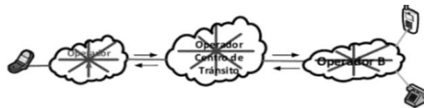
DIAGRAMA 1: Operador destino con conexión directa

Las partes de esta manera modificaron los Anexos B y C con el fin de incluir las especificaciones técnicas para el servicio de tránsito. Las partes incluyeron las disposiciones técnicas correspondientes en el "Anexo B: especificaciones técnicas y de aseguramiento" incluyendo los siguientes diagramas: