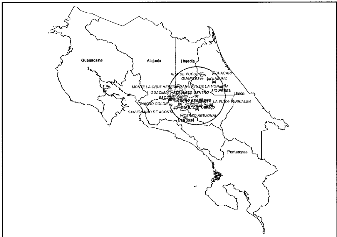
Imagen 1. Representación de la cobertura otorgada al concesionario del canal 48 sobre el mapa de Costa Rica 2

De conformidad con el contrato de concesión N° 005-2008 CNR, para las transmisiones del canal 48 se le autorizó al concesionario la instalación de un transmisor en el Volcán Irazú con una cobertura de 45 km alrededor del punto de transmisión autorizado como lo muestra la imagen 1. Para el caso del canal 57, mediante el contrato de concesión N° 007-2008 CNR, se le autorizó a Asociación Lumen La Granja San Pedro la instalación de dos transmisores ubicados en el Cerro Santa Elena y en el Cerro Buena Vista, con una cobertura de 45 kilómetros alrededor de los puntos de transmisión, tal y como lo muestra la imagen 2.