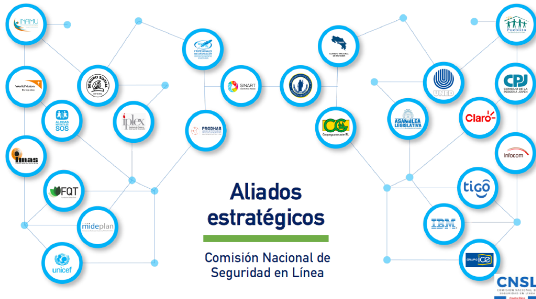
Figura 2 Aliados estratégicos de la Comisión Nacional de Seguridad en Línea

XXIII. Que con respecto a las competencias que le fueron otorgadas a la CNSL, el Decreto Ejecutivo 36274-MICITT-2010 enlista las siguientes: