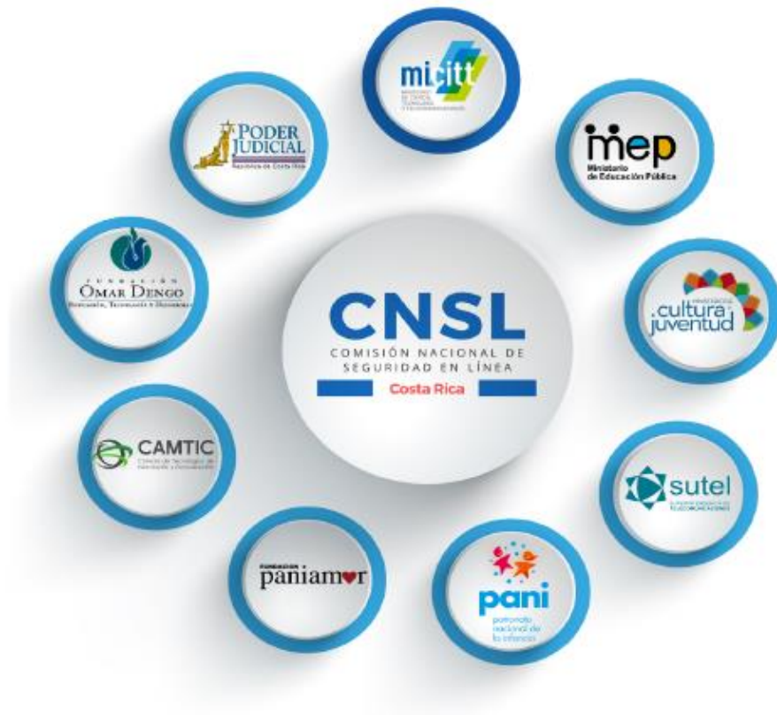
Figura 1 Instituciones y organizaciones que integran la Comisión Nacional de Seguridad en Línea

Además de las instituciones y organizaciones señaladas, la CNSL cuenta con el apoyo y participación de aliados estratégicos; los cuales se muestran a continuación: