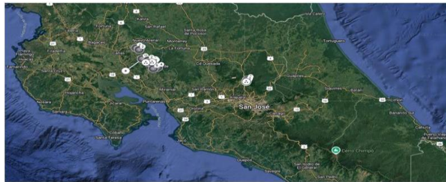
Imagen N° 6: Extracto de la información publicada en el sitio WEB del operador. 13

l) Ajustar el mapa de alcance de red para que sea interactivo y muestre la cobertura del servicio con una desagregación de provincia, cantón, distrito y poblado, de conformidad con el artículo 16 del RPCS, ya que el mostrado en el sitio WEB corresponde a una imagen: -----