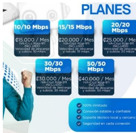
Imagen N° 2: Extracto de la información publicada en el sitio WEB del operador. 9

d) En la oferta comercial de los servicios debe quedar claro si el precio final incluye el alquiler del equipo terminal y qué monto corresponde a dicho alquiler, conforme los artículos 11 inciso 1) y 2) subinciso ii RPUF: -----