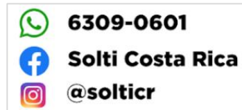
Imagen N° 1: Extracto de la información publicada en el sitio WEB del operador. 8

d) En la oferta comercial de los servicios debe quedar claro si el precio final incluye el alquiler del equipo terminal y qué monto corresponde a dicho alquiler, conforme los artículos 11 inciso 1) y 2) subinciso ii RPUF: -----