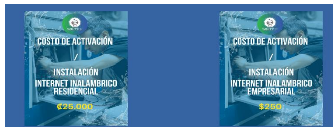
Imagen N° 5: Extracto de la información publicada en el sitio WEB del operador. 12