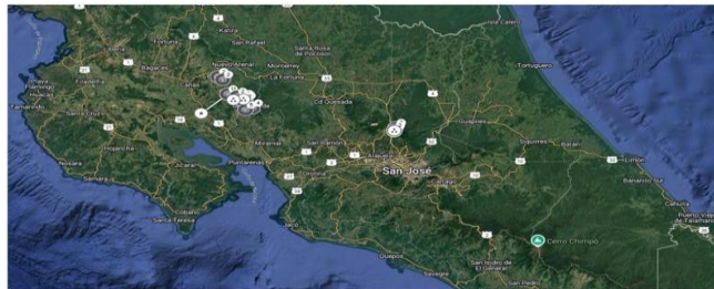
Imagen N° 6: Extracto de la información publicada en el sitio WEB del operador. 13