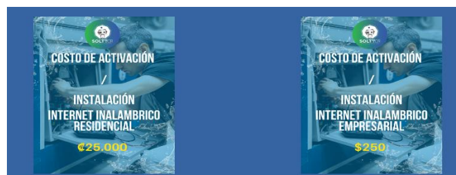
Imagen N° 5: Extracto de la información publicada en el sitio WEB del operador. 12

k) Aclarar si los costos de instalación y activación de los servicios incluyen el impuesto de valor agregado (IVA), en atención al artículo 3 inciso 47) del RPUF: -----